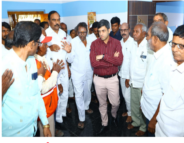
యాదాద్రి భువనగిరి, తెలంగాణ ప్రతిపక్ష పత్రిక ముఖ్యమంత్రి గౌడ్. సెంటర్లో అందిస్తున్న సేవలపై సమగ్రంగా వివరాలు అడిగి తెలుసుకున్నారు. డే కేర్ సెంటర్లో ప్రస్తుతం ఎంత మంది వయోవృద్ధులు సేవలు పొందుతున్నారని అడిగి

తెలుసుకున్నారు. వారికి అవసరమైన సౌకర్యాలు, ఆహారం, వైద్య సేవలు సక్రమంగా అందుతున్నాయా అనే విషయాలను పరిశీలించారు. అలాగే సెంటర్లో ఎంత మంది నిబ్బంది పనిచేస్తున్నారని, ఆరా తీశారు. వృద్ధులు విశ్రాంతి తీసుకునే గదులను కలెక్టర్ పరిశీలించి, పరిశుభ్రత, సౌకర్యాల నిర్వహణపై సూచనలు ఇచ్చారు. వృద్ధులకు సౌకర్య వంతమైన వాతావరణం కల్పించాలన్నారు. డే కేర్ సెంటర్లో ఉన్న డాక్టర్ మరియు మెడికల్ సిబ్బంది తో మాట్లాడి, వృద్ధులకు అందిస్తున్న వైద్య సేవలు, చికిత్స విధానాలపై వివరాలు తెలుసుకున్నారు. వృద్ధుల ఆరోగ్యాన్ని కాపాడటంలో వైద్య సిబ్బంది పాత్ర కీలకమని, వారికి అవసరమైన అన్ని రకాల చికిత్సలు సమయానికి అందించాలన్నారు. వయోవృద్ధుల సంక్షేమం కోసం ప్రభుత్వం చేపడుతున్న కార్యక్రమాలను సమర్థవంతంగా అమలు చేయాలని కలెక్టర్ సూచించారు. ఈ కార్యక్రమంలో సంబంధిత అధికారులు పాల్గొన్నారు.