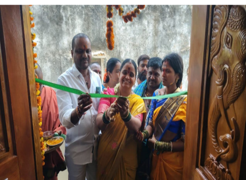
యాదాద్రి భువనగిరి, తెలంగాణ ప్రతిపక్ష పత్రిక ముఖ్యమంత్రి గౌడ్.