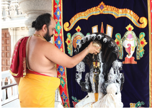
చూడముచ్చు టగా నిర్వహించ బడ్డాయి. ఈ సందర్భంగా స్వామివారికి స్న పన తిరు మంజనం నిర్వహించి, విశేషా ఆలంకరణ చేశారు. అనంతరం సుదర్శన వరసింహ హోమం నిర్వహించి దేశకాంతి సమృద్ధి కోసం ప్రత్యేక ప్రార్థనలు నిర్వహించడ జరిగింది. భక్తులు పెద్ద సంఖ్యలో పాల్గొని