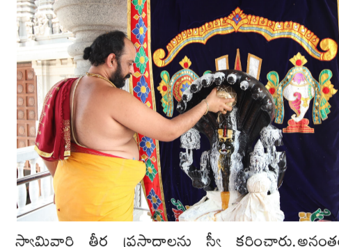
స్వామివారి తీర్థ ప్రసాదాలను స్వీ కరించారు. అనంతరం శ్రీదేవిభూదే వి సమేత శ్రీ స్వర్ణ గిరి వెంకటేశ్వర స్వామి వారిని దర్శించుకున్నారు. అనంతరం స్వామివారి నిత్య అన్న ప్రసాద వితరణ జరిగింది. ఈ కార్యక్రమంలో భాగంగా నేడు సుమారు 2500 మందికి పైగా భక్తులు స్వామివారి అన్న ప్రసాదాన్ని స్వీకరించారు.