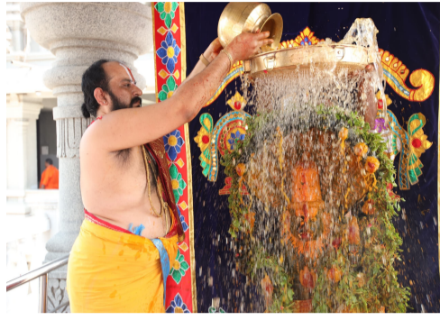
యాదాద్రి ఘనగిరి. తేహాలా న్యూస్ తెలంగాణ రాష్ట్రంలోని ప్రముఖ వైష్ణవ పుణ్యక్షేత్రమైన స్వర్ణగిరి దే వాలయంలో శ్రీ నరసింహ స్వామి జయంతివేడుకలు ఆలయప్రధాన అధ్యక్షులు దిట్టకవి శ్రవణా చార్యు ల దివ్య కరమలతో అత్యంత భక్తి శ్రద్ధలతో వైభవంగా