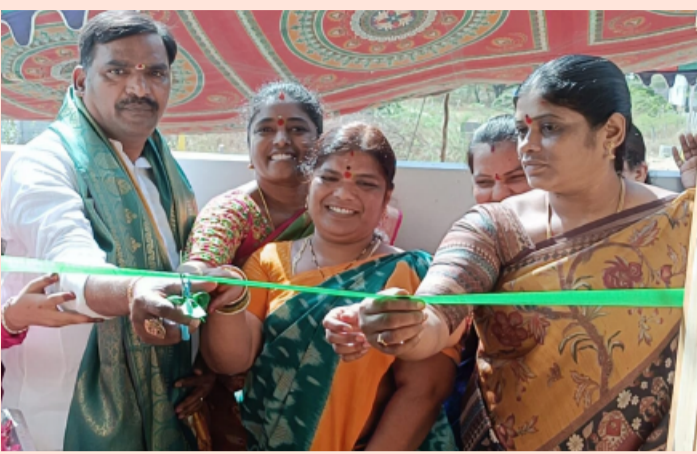
యాదాద్రి భువనగిరి. తేహెల్తా న్యూస్: