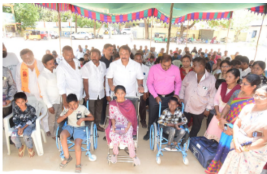
ఈ సందర్భంగా ప్రత్యేక అవసరాలు కలిగిన విద్యార్థులకు అవసరమైన ఉపకరణాలు, సహాయక పరికరాలను అందజేశారు. వారి విద్యాభివృద్ధి, స్వయం ఆధారిత జీవనం మరియు సాధారణ జీవన విధానంలో మరింత సౌలభ్యం కల్పించాలనే