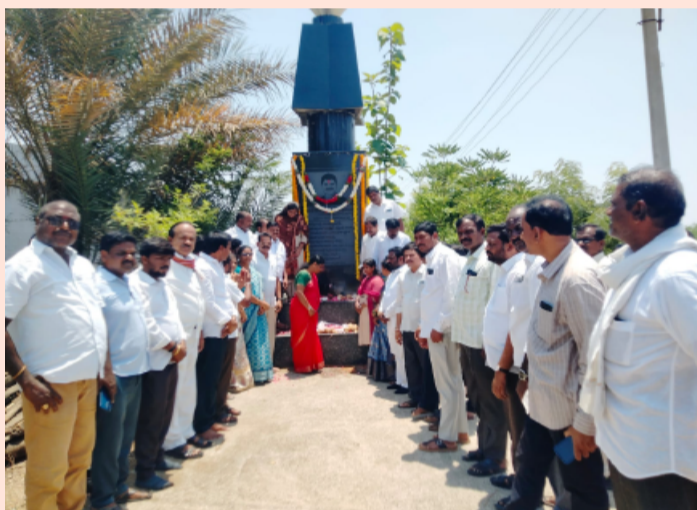
యాదాద్రి భువనగిరి. న్యూస్: