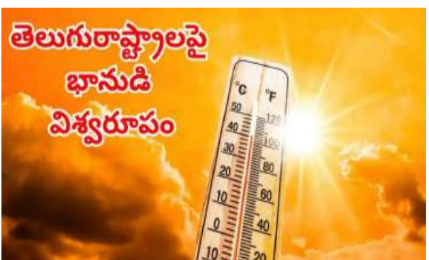
తేలూ న్యూస్ : ఏడాది వేసవికాలం మొదటి నుంచి రెండు తెలుగు రాష్ట్రాల్లో భిన్న వాతావరణ పరిస్థితులు కనిపించాయి. కొన్ని ప్రాంతాల్లో ఉదయం నుంచి మధ్యాహ్నం వరకు రికార్డు స్థాయిలో ఉష్ణోగ్రతలు నమోదు కాగా సాయంత్రం అవ్వగానే వాతావరణం చల్లబడి వర్షాలు కురిసేవి. కానీ రాబోయే రోజుల్లో మూత్రం సీన్ మారబోతుందని వాతావరణశాఖ హెచ్చరికలు జారీ చేసింది. నేటి నుంచి రెండు రాష్ట్రాల్లో ఉష్ణోగ్రతలు 2లో..