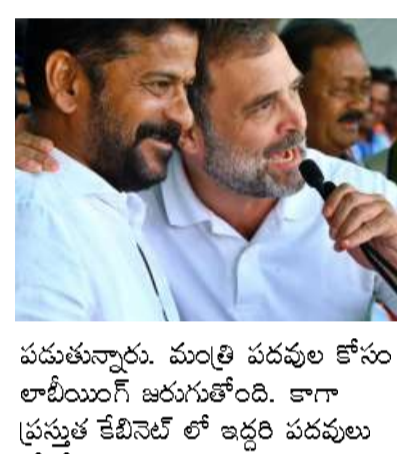
పడుతున్నారు. మంత్రి పదవుల కోసం లాబియింగ్ జరుగుతోంది. కాగా ప్రస్తుత కేబీనెట్ లో ఇద్దరి పదవులు కోల్పోవటం ఖాయమని తెలుస్తోంది. అదే విధంగా ముగ్గురికి కొత్తగా ఛాన్స్ దక్కనుంది. దీంతో కేబీనెట్ లో ఎవరికి అవకాశం 2లో..