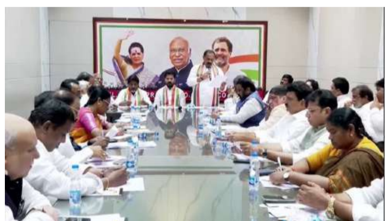
తేలూ న్యూస్: అయిదు రాష్ట్రాల ఎన్నికలు పూర్తి కావడంతో తెలంగాణ లో మంత్రిపద ప్రక్షాళన పార్టీ పదవుల పైన కనరత్తు జరుగుతోంది. మంత్రిపద ప్రక్షాళన పార్టీ పదవులపైన కనరత్తు ఆశావాహలు ఢిల్లీ బాట దీంతో, పలువురు ఆశావాహలు ఢిల్లీ బాట

●ఇప్పటికే మంత్రుల పని తీరు పైన హైకమాండ్ కు నివేదిక ●మంత్రిపద ప్రక్షాళన పార్టీ పదవులపైన కనరత్తు ఆశావాహలు ఢిల్లీ బాట! ●రేవంత్ ఆలోచన ప్రణాళికల మేరకే కేబీనెట్ ప్రక్షాళన మంత్రులు అయ్యేవారా? ●ఫిల్లీపెద్దలను ప్రసన్నం చేసు కునేందుకు ఆశావాహలు లాభియింగ్!