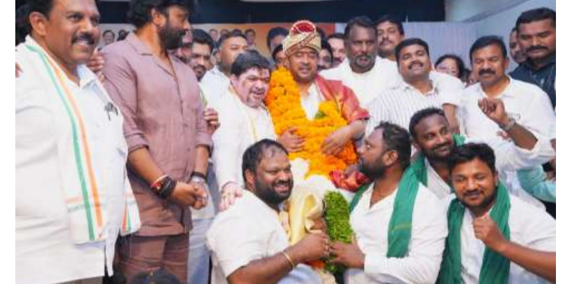
రాష్ట్ర బీసీ సంక్షేమ శాఖ మంత్రి పొన్నం ప్రభాకర్ తెలిపారు తేలూ న్యూస్ మున్నూరు కాపు రాష్ట్ర కార్పొరేషన్ చైర్మన్ బొమ్మ శ్రీరామ్ చక్రవర్తి ఆధ్వర్యంలో మున్నూరు కాపు సోదరులకు సంక్షేమ కార్యక్రమాలు, ఉపాధి అవకాశాలు కల్పించే కార్యక్రమాలు చేపడతామని రాష్ట్ర బీసీ 2